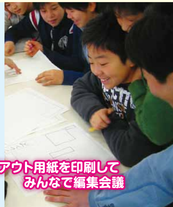
レイアウト用紙を印刷して みんなで編集会議